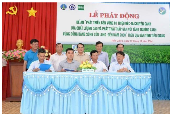
Đại diện Chi nhánh Thương mại Con Voi Ký kết đề án “Phát triển bền vững 1 triệu hecta lúa chất lượng cao, phát thải thấp” tại tỉnh Tiền Giang.

• Phân bón Con Voi Bình Dương tham gia đề án “Phát triển bền vững 1 triệu hecta lúa chất lượng cao, phát thải thấp” tại tỉnh Tiền Giang. Sở Nông nghiệp và Phát triển Nông thôn tỉnh Tiền Giang vừa phát động đề án “Phát triển bền vững 1 triệu hecta lúa chất lượng cao, phát thải thấp gắn với tăng trưởng xanh vùng Đồng bằng sông Cửu Long đến năm 2030”. Đề án được triển khai tại 7 huyện thị thành của tỉnh gồm: Cái Bè, Cai Lậy, Tân Phước, Gò Công Tây, Gò Công Đông, TX Cai Lậy và TP Gò Công. Tham gia thực hiện đề án, đại diện Phân bón Hữu cơ Con Voi Bình Dương được giao nhiệm vụ tổ chức tập huấn, đào tạo các nội dung, quy trình kỹ thuật sản xuất lúa chất lượng cao, phát thải thấp; quy trình xử lý rơm rạ theo hướng nông nghiệp tuần hoàn; sản xuất lúa “1 phải 5 giảm”; ứng dụng công nghệ cao và cơ giới hóa đồng bộ.