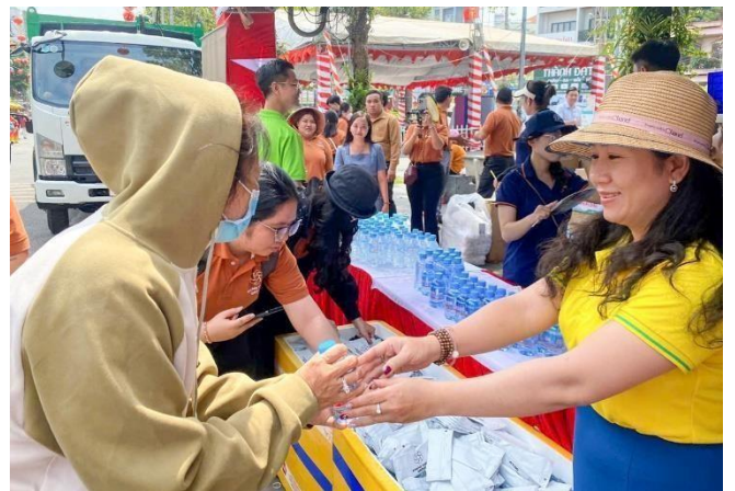
Khách hàng hưởng Lễ hội Rằm tháng Giêng nhận khăn lạnh, nước uống từ quầy hàng miễn phí BIWASE ION -GOLD

• BIWASE ION-GOLD đồng hành Lễ hội Miễn phí. Hưởng ứng chủ trương của Thành ủy Thủ Dầu Một về xây dựng nếp sống văn minh đô thị, chung tay tổ chức Lễ hội Rằm tháng Giêng thành Lễ hội Miễn phí mang đậm bản sắc văn hóa, nhân văn đặc trưng của người Bình Dương. Công ty TNHH MTV Sản xuất - Thương mại - Dịch vụ BIWASE P.T.S phối hợp Hội Doanh nhân trẻ tỉnh Bình Dương mở quầy phục vụ nước uống, khăn lạnh miễn phí cho khách thập phương đến tham quan Lễ hội Rằm tháng Giêng tại miếu Bà Thiên Hậu (ngã sáu Thủ Dầu Một). Ngoài ra Công ty TNHH MTV BIWASE P.T.S còn hỗ trợ các đại lý, nhà bán lẻ trên địa bàn tham gia phục vụ lễ hội bằng chương trình khuyến mãi đặc biệt “mua 50 thùng tặng 10 thùng” qua đường dây bán hàng trực tiếp 0813.669.996.