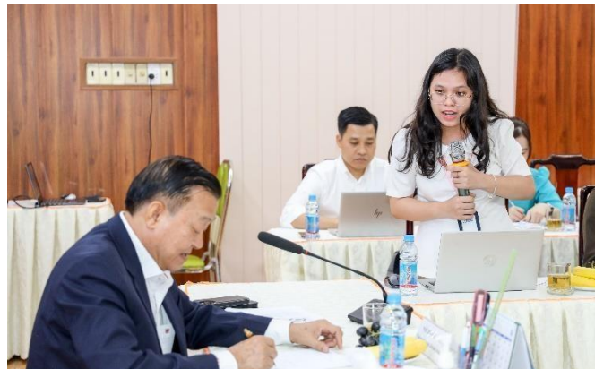
Các nhà đầu tư, nhà báo đặt câu hỏi và được lãnh đạo BIWASE giải đáp thỏa đáng.

• Gặp gỡ nhà đầu tư, giới thiệu triển vọng năm 2025. Ngày 10/02/2025 Lãnh đạo Công ty CP – Tổng công ty Nước – Môi trường Bình Dương (BIWASE) đã có buổi gặp mặt nhà đầu tư, các cơ quan báo chí, giới thiệu kết quả sản xuất kinh doanh năm 2024, triển vọng năm 2025 và chiến lược dài hạn. Trong tỉnh Bình Dương, BIWASE hiện quản lý, vận hành 9 nhà máy nước cùng hệ thống phân phối 6,969 km, 1 khu liên hợp xử lý rác, 4 nhà máy xử lý nước thải. Ngoài tỉnh, BIWASE quản lý vận hành 17 nhà máy nước trải dài từ TP. Hồ Chí Minh, Long An, Vĩnh Long, Cần Thơ, Bình Phước, Đồng Nai, Quảng Bình... Do tập trung kéo giảm tỷ lệ thất thoát nước dưới 5%, tổng doanh thu năm 2024 của BIWASE vượt lên 4.387 tỷ đồng, tăng 10% so với năm 2023. Cổ tức dự kiến được chia bằng tiền mặt, lợi nhuận 13%/cổ phiếu. Năm 2025 là năm nhiều triển vọng tăng trưởng đi liền với không ít thách thức khi tỉnh Bình Dương đặt mục tiêu vượt qua “bẫy” thu nhập trung bình, đạt tăng trưởng GRDP 2 con số. Nhờ bám sát nhiệm vụ sản xuất – kinh doanh, chủ động “đi tắt đón đầu” đã tăng trưởng, phát triển của tỉnh, BIWASE sẵn sàng đáp ứng nhu cầu nước sạch chất lượng cao cho sinh hoạt, công nghiệp, đô thị của tỉnh Bình Dương và các địa phương khác có yêu cầu.