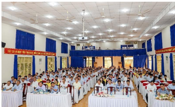
160 cán bộ chủ chốt thuộc các bộ phận, chi nhánh, công ty trực thuộc Tổng công ty BIWASE về dự họp mặt.

• Nhiều tỉnh thành, địa phương gửi thư cảm ơn Tổng công ty BIWASE. Đồng hành cùng lãnh đạo các tỉnh thành, địa phương mang mùa xuân đến các hộ nghèo, gia đình chính sách khó khăn, nơi có đông đồng bào dân tộc thiểu số, vùng biên giới. Nhiều năm qua lãnh đạo Công ty CP - Tổng công ty Nước Môi trường Bình Dương đã sát cánh cùng lãnh đạo các tỉnh thành, địa phương duy trì và làm tốt công tác mang Tết đến mọi người, mọi nhà “không để ai bị bỏ lại phía sau”. dịp này UBND tỉnh Bình Phước, Hội Nạn nhân Chất độc Da Cam/Dioxin tỉnh Bình Dương, UBND các xã biên giới Hưng Phước, Phước Thiện tỉnh Bình Phước đã gửi thư cảm ơn Tổng công ty BIWASE.