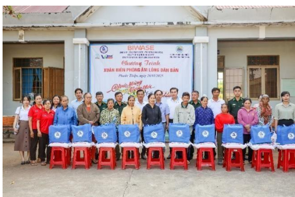
Đoàn công tác Tổng công ty BIWASE thăm chúc Tết và tặng quà cho người dân các xã biên giới Phước Thiện, Hưng Phước, huyện Bù Đốp, tỉnh Bình Phước

• Công đoàn BIWASE và chương trình “Xuân Biên phòng ấm lòng dân bản”. Đã thành truyền thống, mỗi khi Tết đến, Xuân về Lãnh đạo và BCH Công đoàn cơ sở Tổng công ty BIWASE thực hiện nhiều chuyến thăm, tặng quà người bệnh đang điều trị tại các bệnh viện, Trung tâm nuôi dưỡng người già, trẻ mồ côi, Trung tâm Bảo trợ xã hội; tặng quà Tết CBCNV, thầy cô giáo đang công tác tại đây. BCH Công đoàn cơ sở còn phối hợp các đơn vị liên quan, lãnh đạo chỉ huy các Đồn Biên phòng Hoàng Diệu, Phước Thiện và huyện Bù Đốp tỉnh Bình Phước, tổ chức chương trình “Xuân Biên phòng ấm lòng dân bản”. Đoàn đã tặng 250 phần quà Tết trị giá 122,5 triệu đồng cho bà con có hoàn cảnh khó khăn tại các xã biên giới Phước Thiện, Hưng Phước, huyện Bù Đốp tỉnh Bình Phước. dịp này